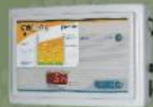
Opcional: CB-100 S

Conheça mais sobre estes e outros produtos fabricados pela Betha Eletrônica, acessando nossa página na internet: