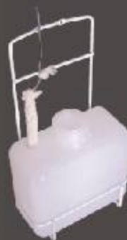
Reservatório de água (De acordo com o modelo do CB)